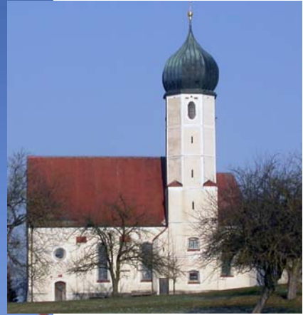
Kirche in Weiterskirchen