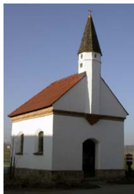
Kapelle in Großrohrsdorf

Die Schwedenkapelle und die Kapelle in Großrohrsdorf bereichern unsere Gemeinde.